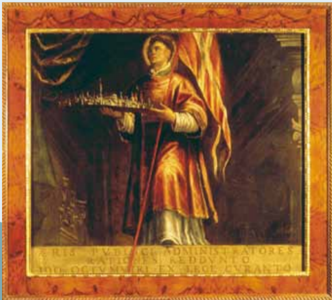
Francesco Maffei (1605 - 1660) Pala raffigurante San Vincenzo che regge la città di Vicenza, 1625 circa, Municipio di Vicenza.