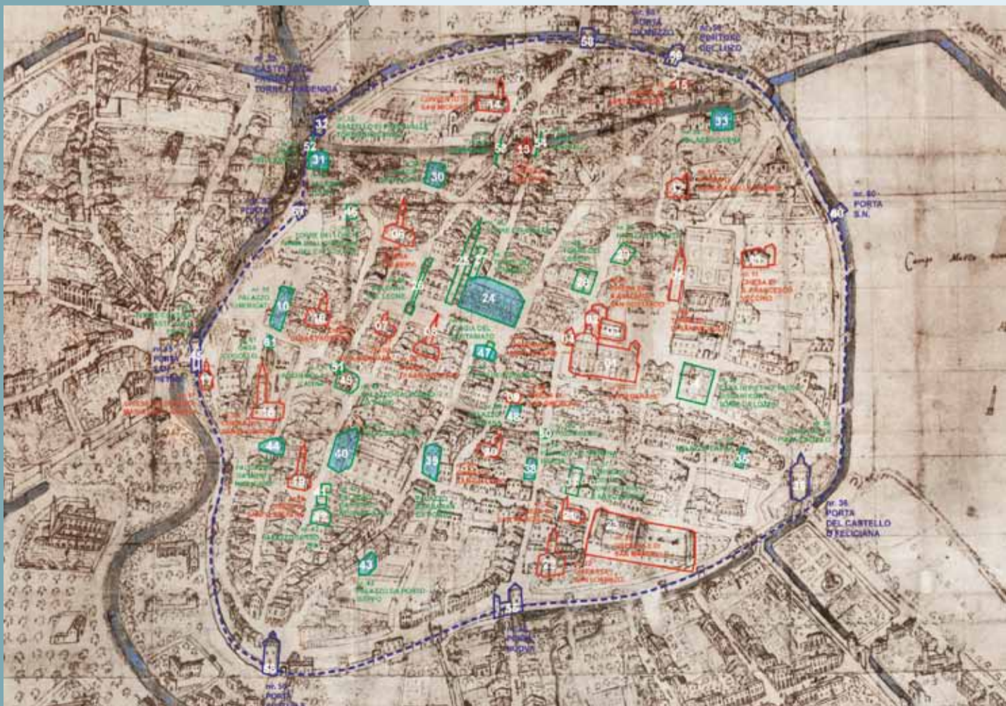
Pianta Angelica della città di Vicenza, 1580 circa [61 edifici maggiormente rappresentativi] Biblioteca Angelica degli Agostiniani di Roma