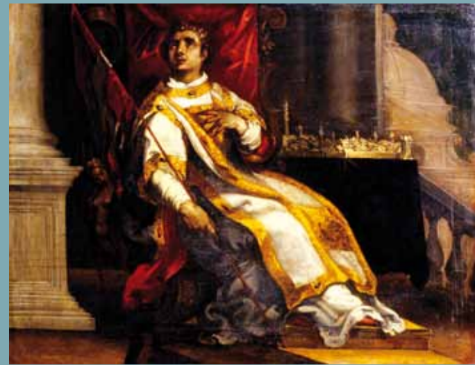
Francesco Maffei (1605 - 1660) Pala raffigurante San Vincenzo con il modello della città di Vicenza, 1625 circa, Museo Diocesano di Vicenza.