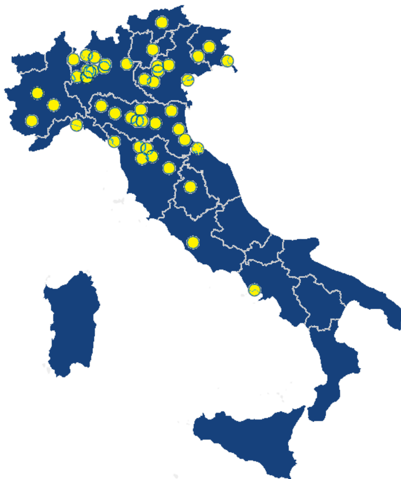
Figura 5 - Gravidanza e parto: distribuzione delle strutture con livello molto alto. Italia, 2024