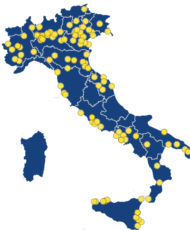
Figura 6 - Ambito osteomuscolare: distribuzione delle strutture con livello molto alto. Italia, 2024