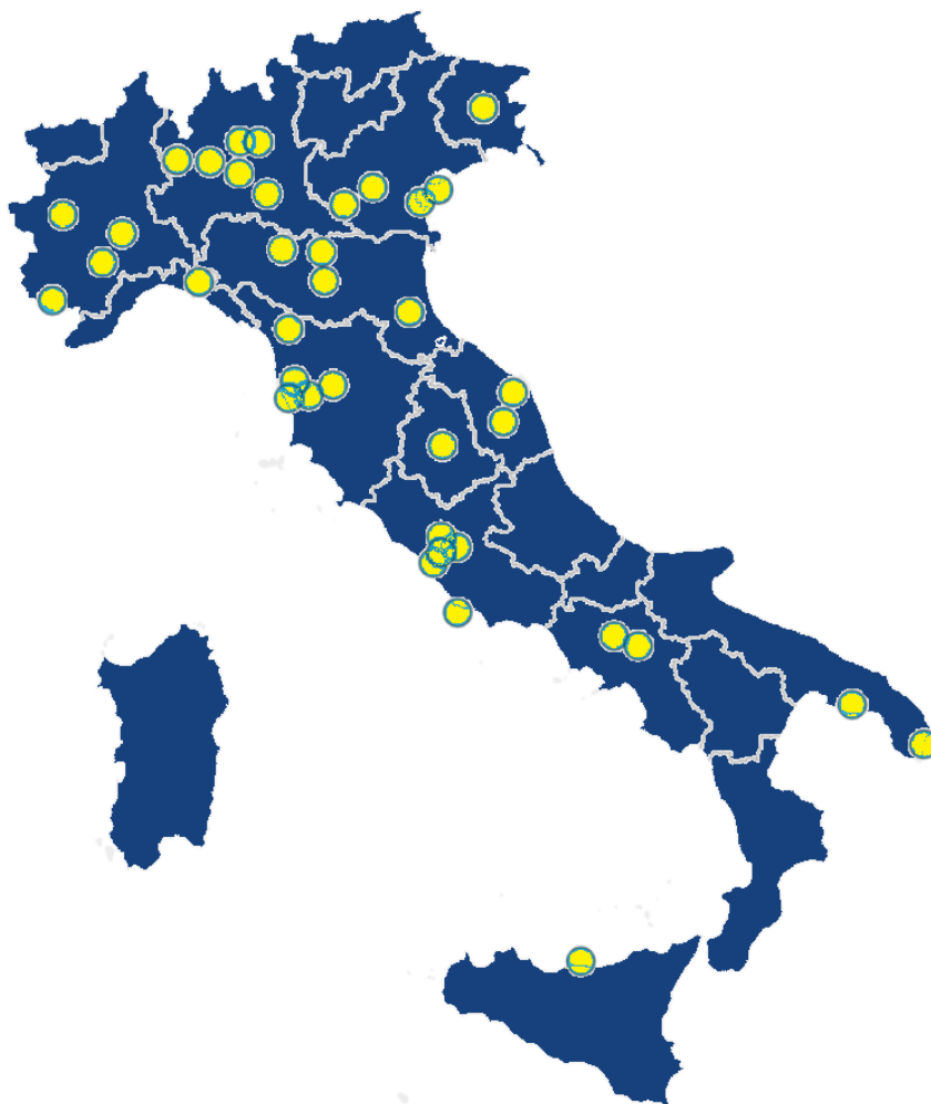
Figura 4 - Chirurgia oncologica: distribuzione delle strutture con livello molto alto. Italia, 2024