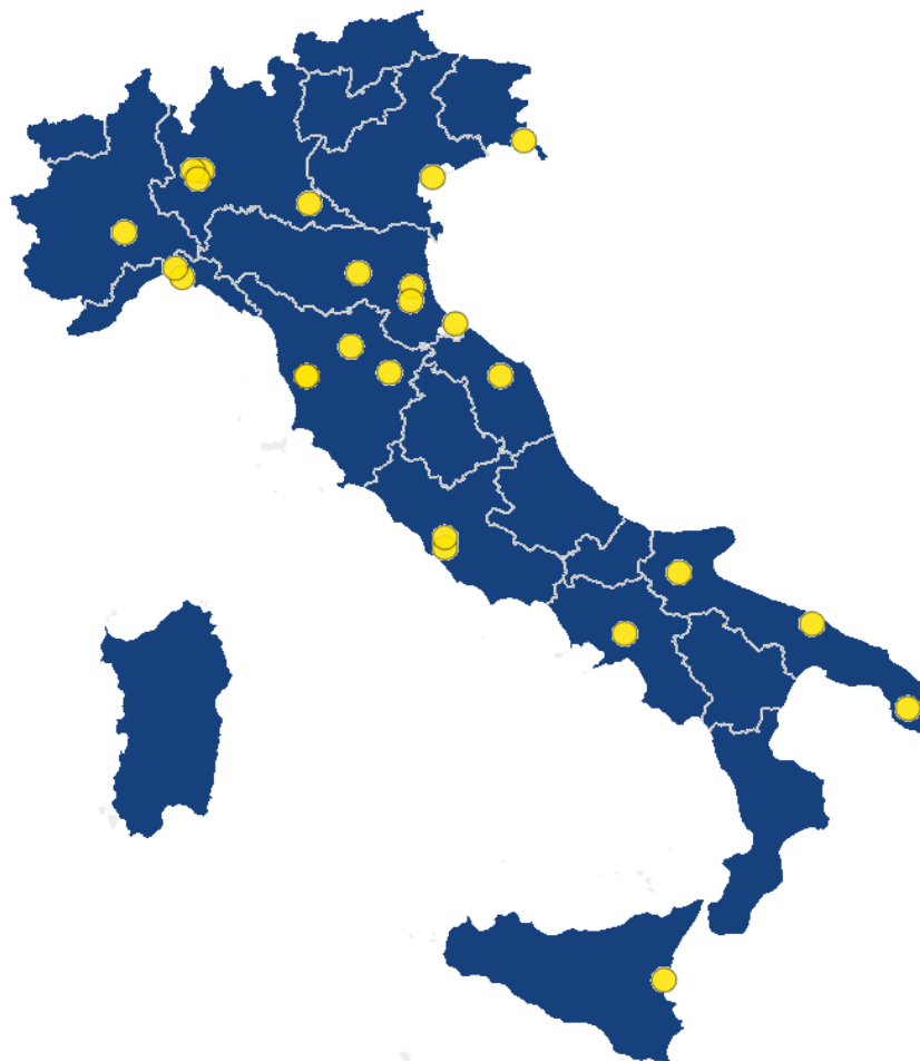
Figura 2 - Ambito cardiocircolatorio: distribuzione delle strutture con livello molto alto. Italia, 2024